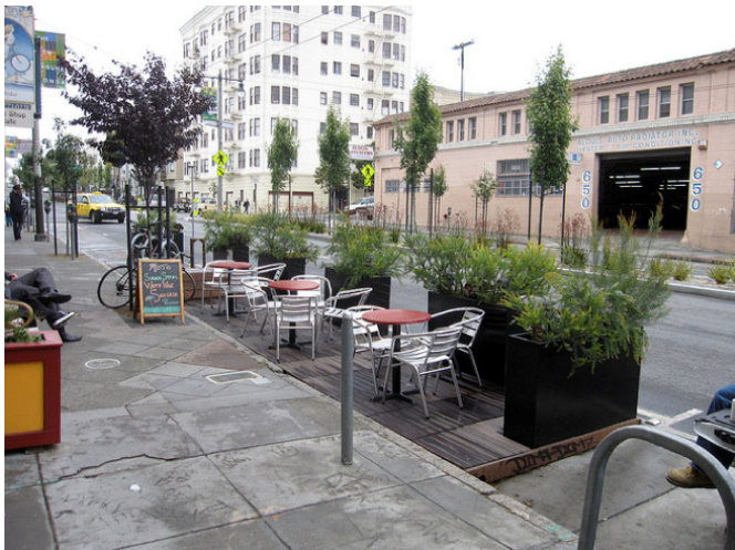
gatvės žalios juostos išnaudojimas