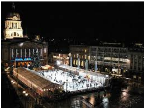
universalumas - Nottingham aikštė